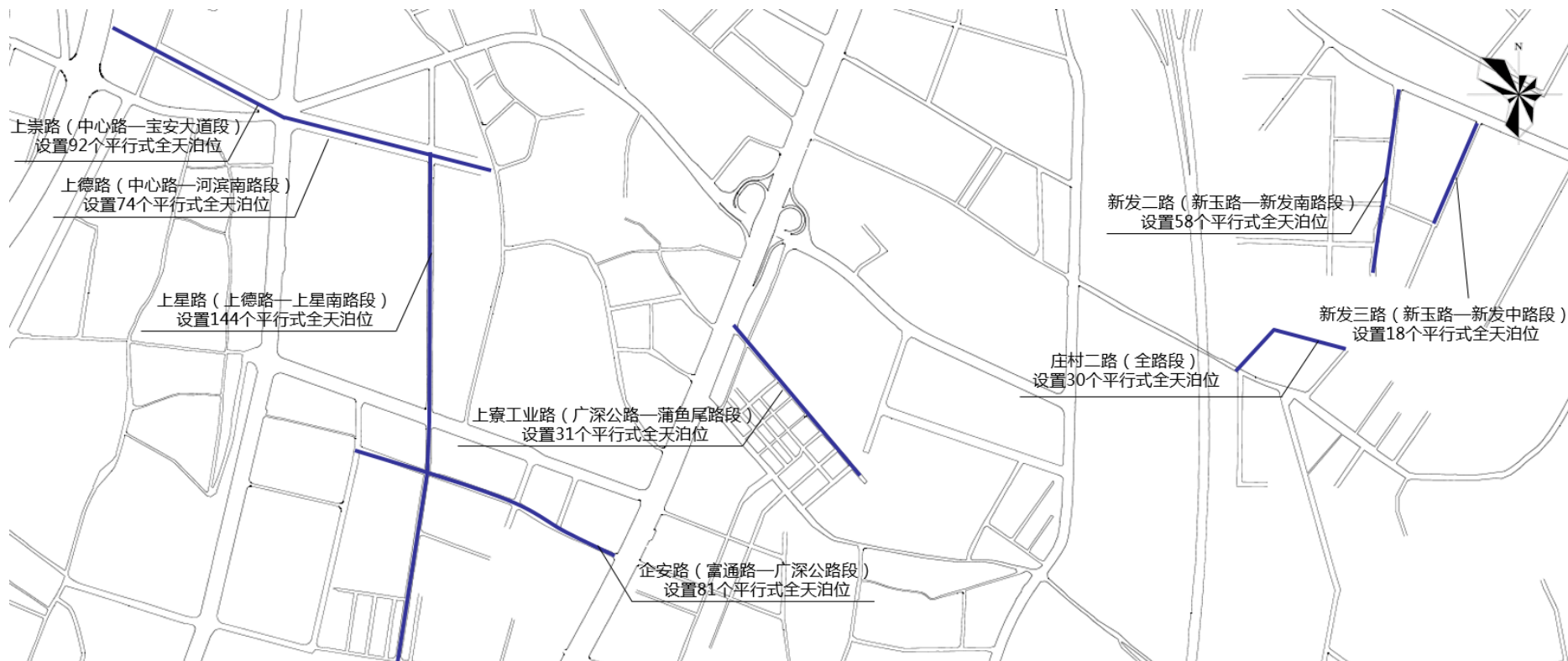
宝安区新桥街道路边停车泊位规划示意图2