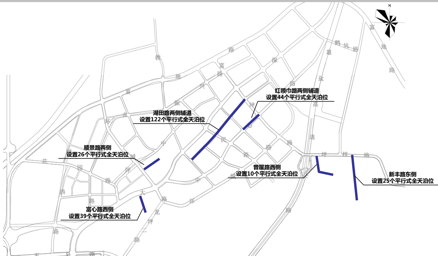
龙岗区坪地街道路边停车泊位规划示意图1